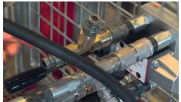
Das Öl sucht sich immer den leichtesten Weg. Durch die unterschiedliche Fertigung der Zylinder steigt der Systemdruck in beiden Kolben nicht gleichzeitig.

Wir müssen die Räume trennen. Wir müssen unser Öl in zwei getrennte Räume schicken. Hier gibt es die Möglichkeit, zum Beispiel einen Mengenteiler einzusetzen, den Zahnradmengenteiler. Dieser Mengenteiler wird durch einen Volumenstrom, der von einer Hydraulikpumpe erzeugt wird, angetrieben und teilt den Volumenstrom – hier vorne haben wir den zentralen Eingang, der diesen Volumenstrom der Pumpe in zwei konstante Größen aufteilt. Ich muss diese Zahnräder natürlich in einer Lagerung führen, die wiederum geschmiert werden muss.